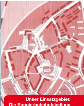
Unser Einsatzgebiet: Die Rangierbahnhofsiedlung