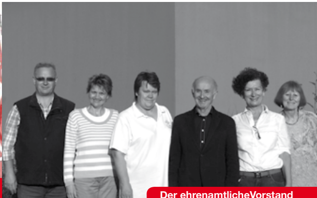
Der ehrenamtliche Vorstand